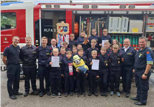
Die Jugendgruppe beim Bezirksjugendlager in Gaming. Beim Bewerb erreichte unsere Gruppe den 3. Platz in Silber.

Mit voller Motivation ging es anschließend zum Landesjugendlager, wo rund 7.000 Jugendliche aus ganz Niederösterreich teilnahmen. Trotz kleiner Fehler, die eine Top-Platzierung verhinderten, erzielte unsere Jugendgruppe: