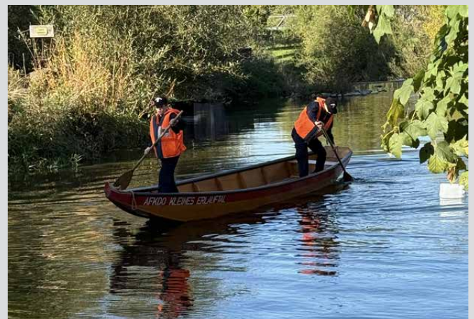
Fertigkeitsabzeichen „Sicher zu Wasser und Land“ Bei einer Station müssen die Teilnehmer die Grundlagen im Wasserdienst unter Beweis stellen und auch mit einer Zille einen Parkour meistern.